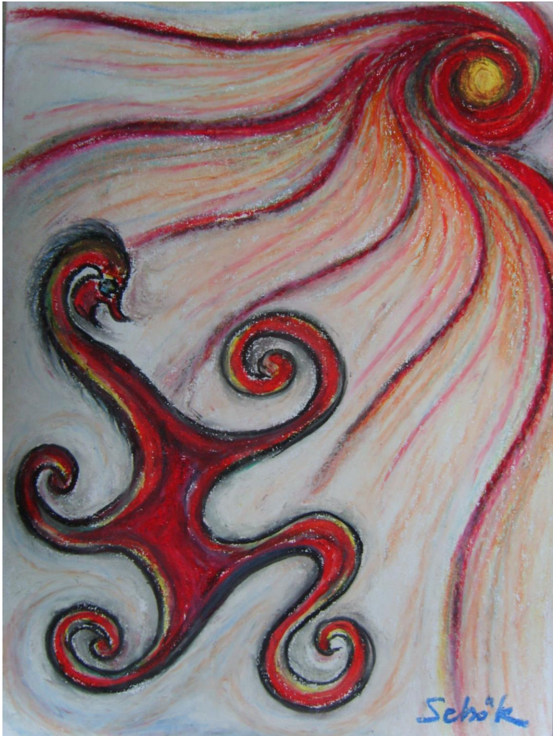
Le défi, 2009, Pastel sur papier carton, 40x30, Sebök Ferenc.

Hier ben ik op het voorplein Liefde en wijsheid Mijn zoektocht gaat maar door